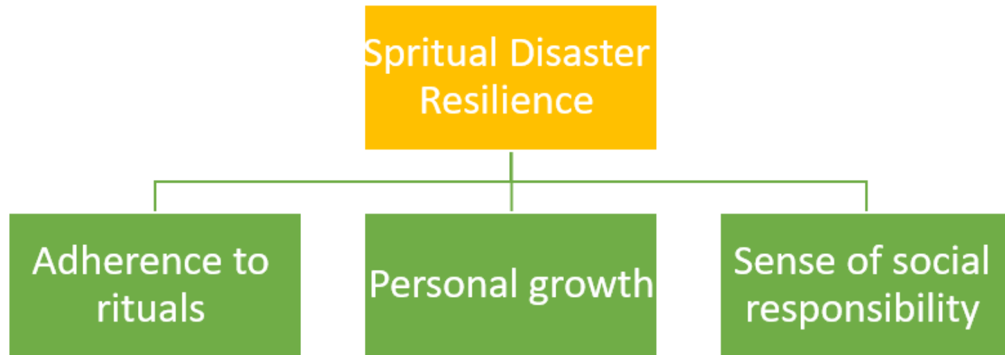
Figure ۲. Domains of spiritual resilience in disasters and emergencies